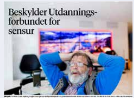
Faksimile fra Bergens Tidende 13.05.16

– Vi spør aldri medlemmene om hva de stemmer i våre egne undersøkelser. Og vi skjønner ikke at dette var relevant denne gangen heller, når denne undersøkelsen skulle handle om våre medlemmers opplevelse av mediene. Det kommuniserte vi tilbake, og vi fikk ingen innvendinger – heller ikke fra Aarebrot, sier Handal på Utdanningsforbundets nettsider.