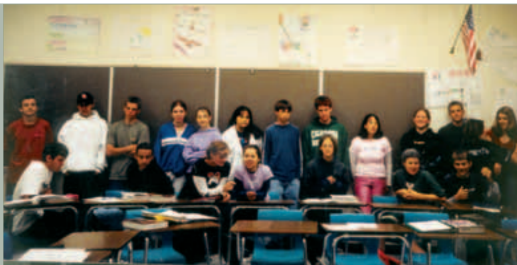
4. klassen min!

Ein av dei store forskjellane mellom amerikansk og norsk vidaregåande skole er at norske elevar kan velje yrkesretta utdanning, medan i USA er seriøs yrkesretting umogleg før på collegenivå. Det einaste som dei får på High School, er litt snekring og matlaging som valfag. Eg opplevde at USA har mange umotivererte elevar som ikkje har kapasitet til å ta innover seg det enorme pensumet. Dette problemet blir løyst ved å opprette spesialklassar som får mindre pensum, og som bruker lengre tid og har spesial-