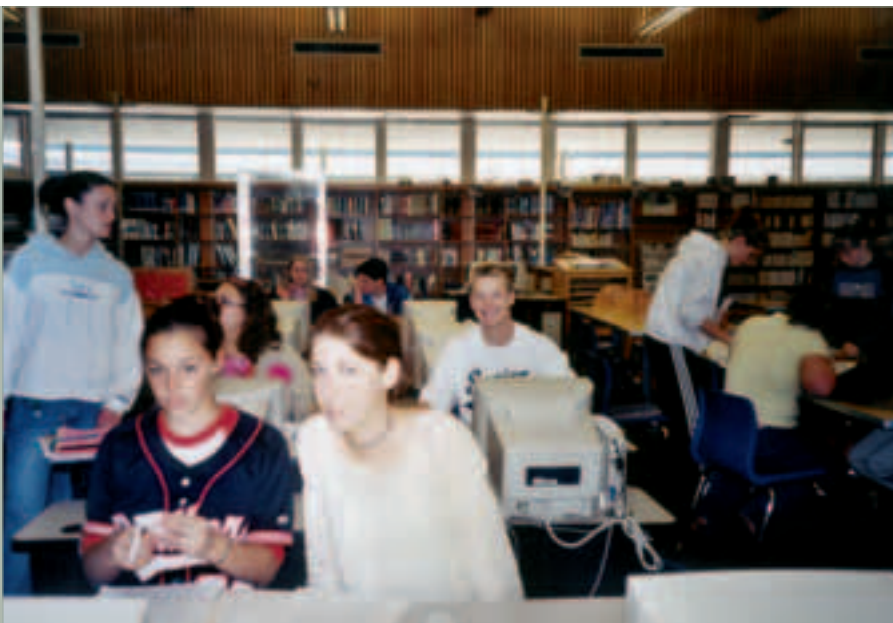
I biblioteket.

For nærare opplysingar sjekk nettsida til Norway Fulbright Foundation for Educational Exchange: http://fulbright.no .