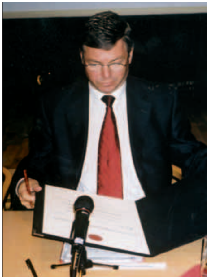
Statsminister Kjell Magne Bondevik gransker manifestet mot mobbing før han undertegner. Burde han ha gransket om denne kampanjen har realistiske mål?