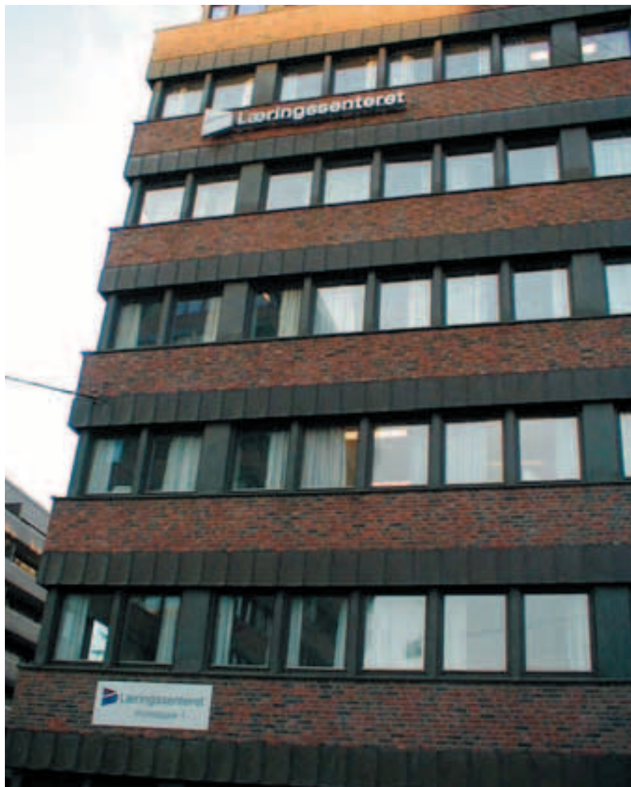
Læringscenteret har lokaler i Kolstadgata 1 på Tøyen i Oslo.

Helhet og mangfold er en forutsetning for en bred kompetanse som grunnlag for livslang læring. Opplæringssystemet