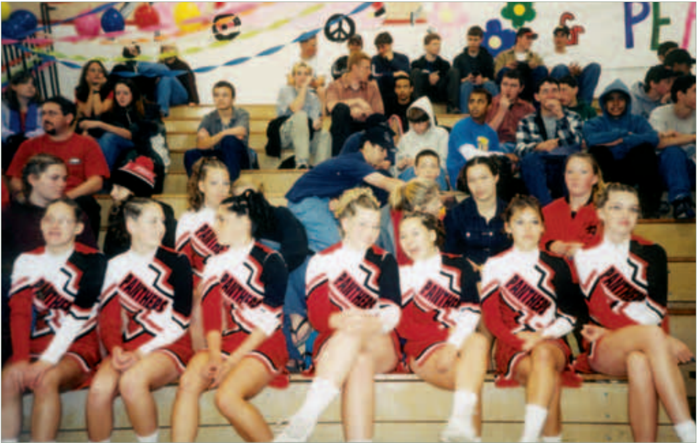
Skolens egne elever er Cheering girls for fotballaget ved skolen. Her viser dei kva dei kan på Rally, ei elevoppvisning.

pedagogiske opplegg i gjennomgåinga av stoffet. Ein av dei fem klassane som eg hadde, var ein spesialklasse. Det var eg ikkje førebudd på. 22 elevar med disiplinproblem og læreveskar i denne klassen førte til at eg måtte bruke mykje av tida og energien min til møte med skoleadministrasjonen, foreldre osv. Eg trudde at eg skulle møte veggen, men heldigvis fekk eg endra timeplanen, og andre overtok denne klassen etter jul. Dermed fekk eg eit mykje meir positivt siste semester.