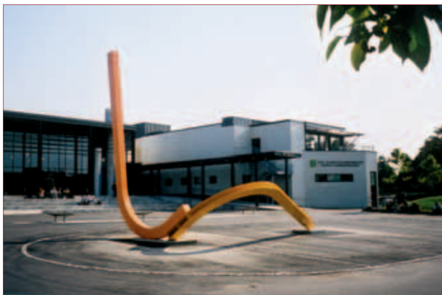
Ingvaldsens skulptur kunne stått på et gatehjørne i New York, sier arkitekt Løvdahl.