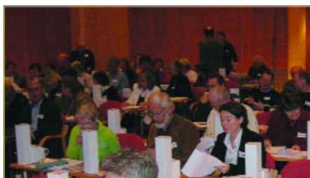
► Landsmøte 2005