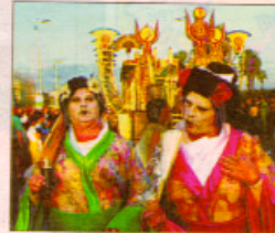
Mer liv i spansk enn tysk?

Jeg leste i dagens Allmen- posten (31. mars) at spansk er veldig populært blant dagens ungdom, og at det sannsynligvis vil bli fransk og spansk som vil ta over for tysken. Jeg går på en stor videregående skole i distrikt-Norge, med over 500 elever. En ting jeg og mine medele- ver på allmenretningen savner, er et tilbud om å lære spansk i stedet for