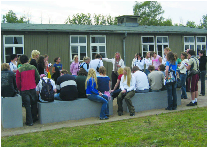
Bilde frå Sachsenhausen