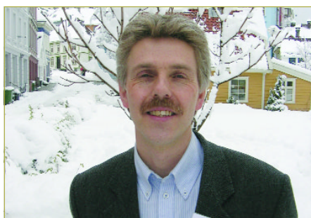
► Fra sentralstyret