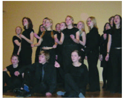
Elever fra Fyllingsdalen videregående skole

Av årsberetning fremgår det at medlemstallet nå er kommet opp i 1390, dvs. 12