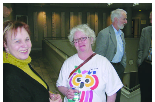
Årets landsmøte var det største i NLLs historie, med over 100 deltakere.