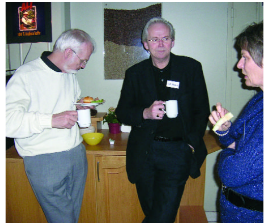
Fra landsmøtet