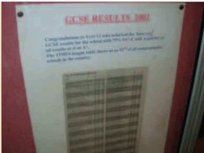
Liga-tabellen for skolar er slått opp. "Vi er nr. 92!"