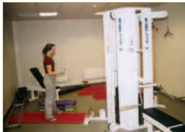
Fra den nye kroppsøvingsavdelingen ved Bergeland videregående skole i Stavanger.