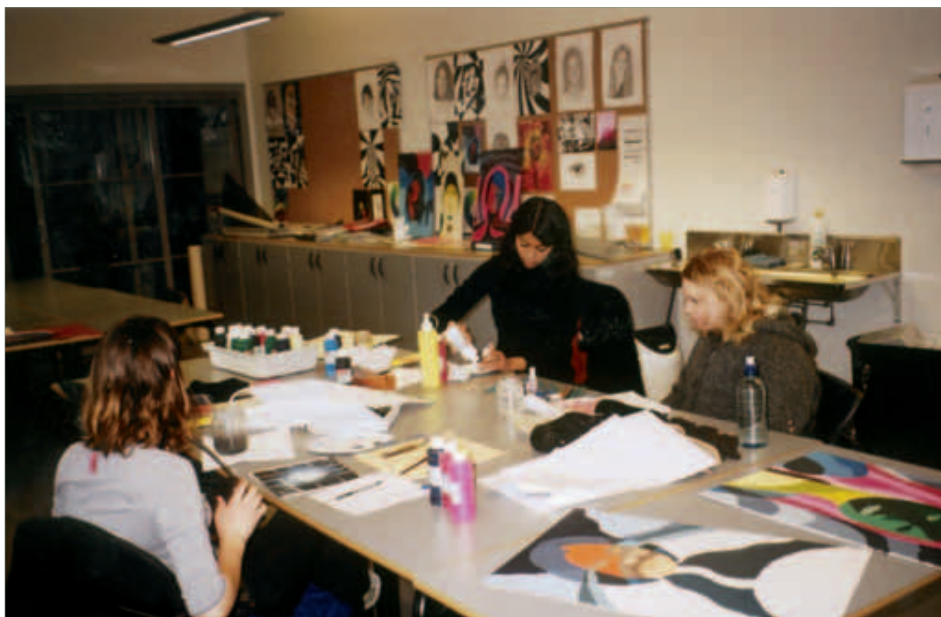
Fra formgivingsavdelingen på Bergeland. Bak glassveggen sitter læreren.