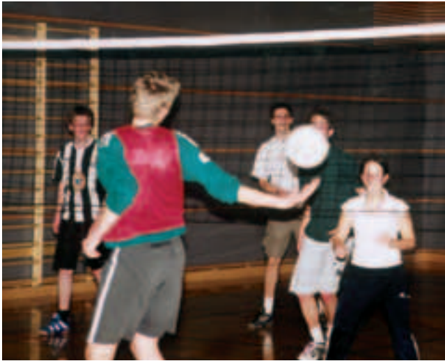
Fra Bergeland vgs.

med en tredjedel hver. Dette er ingen lett jobb, selv for de mest strukturerte og nøyaktige lærerne. Det er kanskje ikke så rart at faget sammen med norsk ligger på klagetoppen når det gjelder klager på standpunkt karakterer.