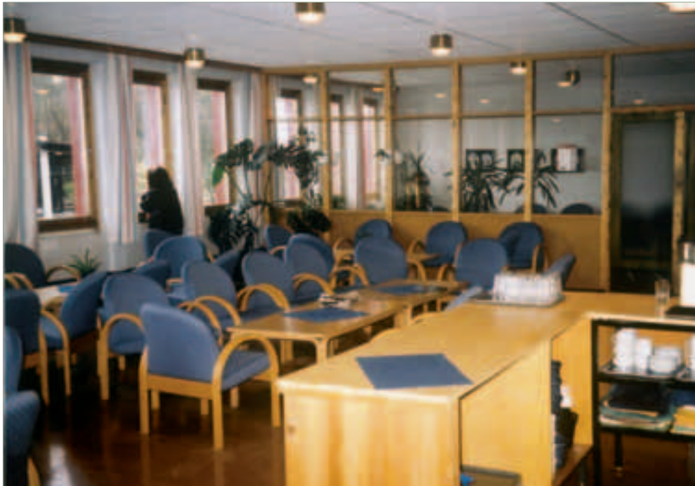
Etter først å ha fjernet dette lærerværelset, må man nå ha nytt lærerværelse i Namsos! Bildet er tatt våren 2000.

Hvordan er det å ha en skole uten lærerværelse?