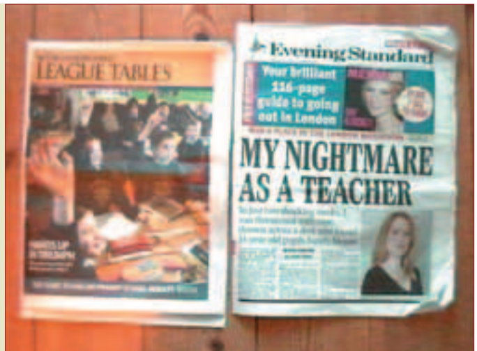
To av sider av moderne engelsk skole. Desse avis-framsidene viser vinnarane og taparene.

legg blant dei elevane som hadde valt å ha engelsk.