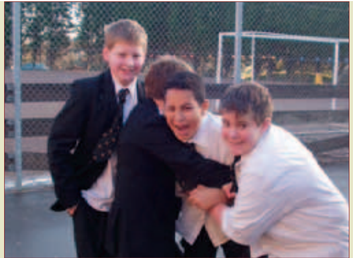
Elevane ved St. Mary's er i alderen frå 11 til 18.

hos oss også, men i England har det heile gått eit par hakk lenger. På "vår" skole hadde dei eit oppslag i den sentrale hall'en der eit klipp frå "The Times" viste at etter dei siste eksamensresultata var skolen nr. 92 i England. Dette var ei plassering ein var stolt av. Den veka vi besøkte landet, kom storavisa The Independent med eit eige vedlegg som var "The League Tables for Schools", med lister som minte under teikna mest om den handsaminga våre aviser gir likningslistene. Litt data-systematisering gjorde det enkelt for avisa å slå opp dei fem beste og dei fem dårlegaste skolane i landet. Det er neppe lenge til vi ser det same hos oss?