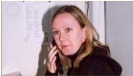
►► Dårlig arbeidsforhold på Nesodden vgs.