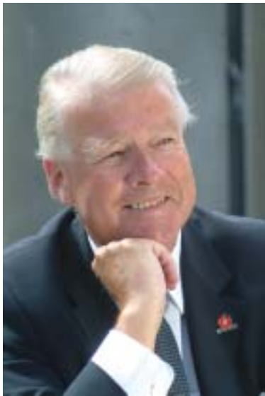
Carl I. Hagen leder Fremskrittspartiet.

Av Carl I. Hagen, formann i Fremskrittspartiet