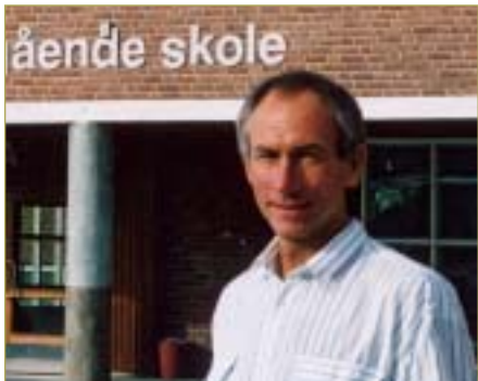
►► Fokus på fysikkfaget