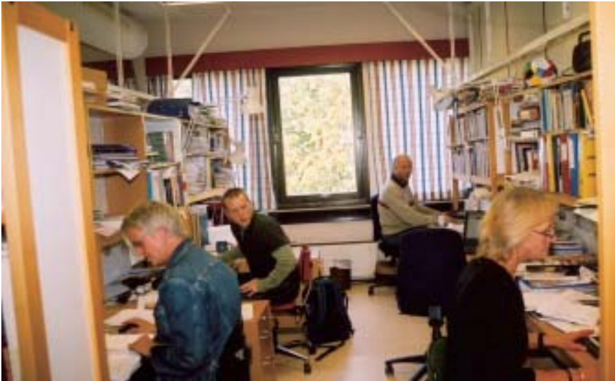
Her sitter det enda to til!

etter lokal vurdering, er tilfredsstillende med hensyn til arbeidsplasser og nødvendige hjelpemidler". Etter min vurde-