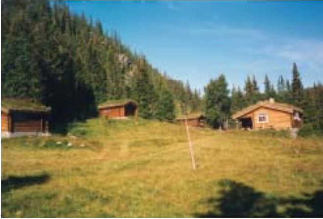
Hytteidyll i Valdres.