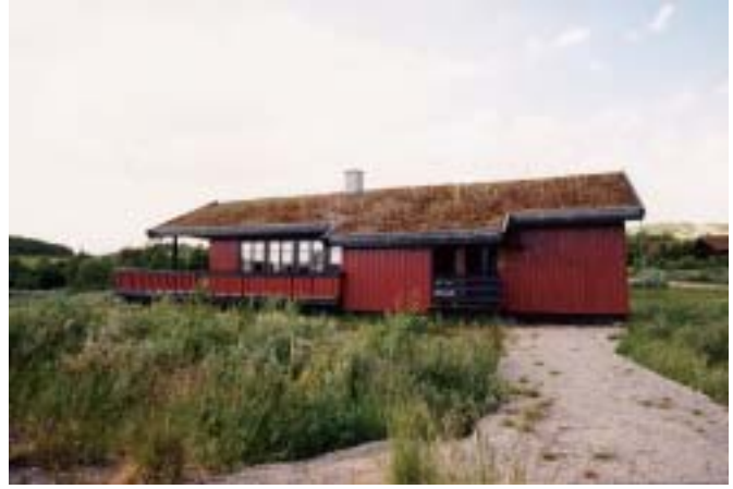
Er hytta klar for vinteren?

etter antikviteter og andre verdier, trenger transportvei helt frem. En solid, ordinær "skogsbilveibom", gjerne plassert på et sted uten utsikt mot hytteområdet, kan være vel så bra som en moderne og kostbar bom. Den sikrer like godt, er billigere og flagger ikke på samme måte at det er fristende bytte å hente ved enden av veien.