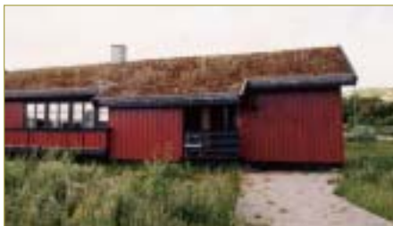
►► Gode råd for å unngå skader på hytta