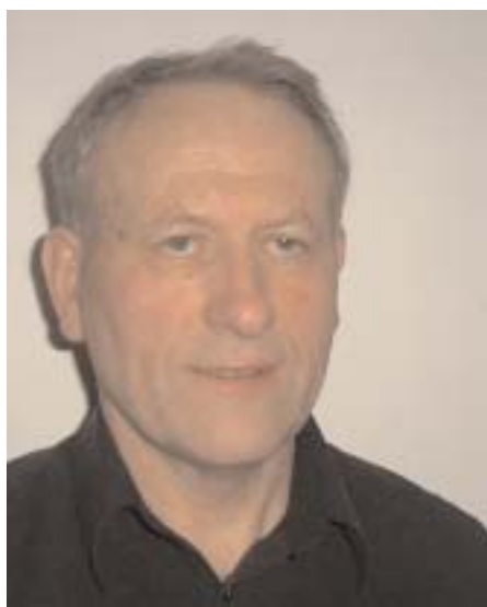
Bjørn Eide