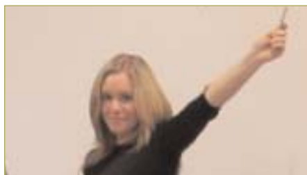
►► Opphold ved Parkskolan