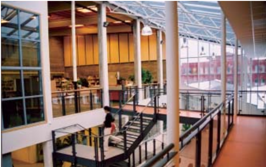
Gymsalen ble bibliotek.