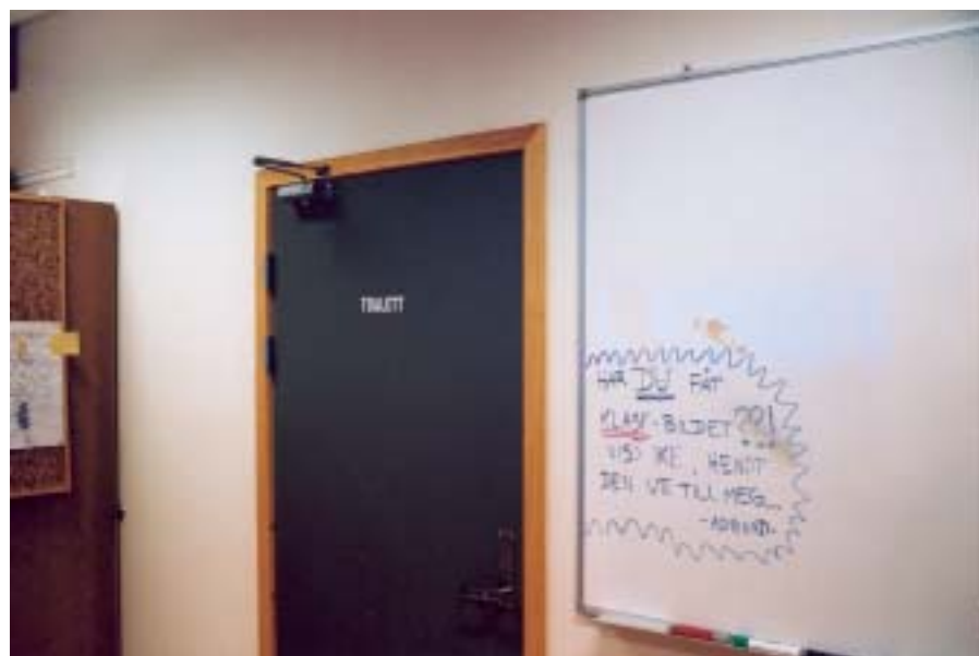
Lærere og elever har felles toalett med inngang ved siden av tavla. Læreren ved tavla må konkurrere med lærer på vei til eller fra toalettet om elevens oppmerksomhet.