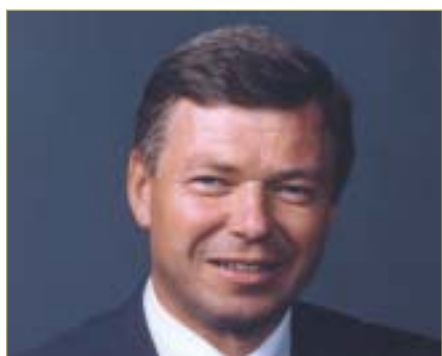
►► Statsministeren skriver i Lektorbladet