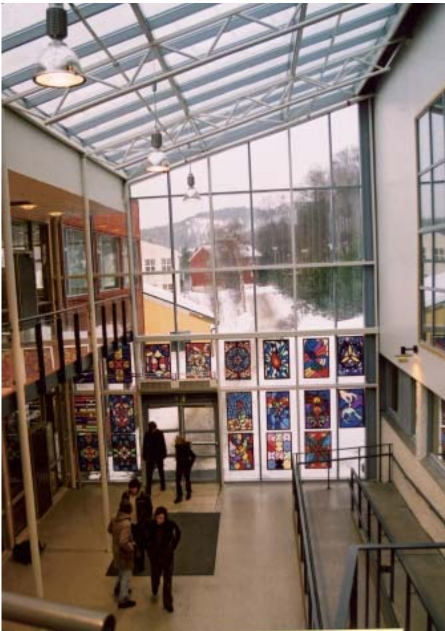
Best plass oppe i lufta på skolen i Namsos.

- Utformingen av bygg og organiseringen av undervisningen i Namsos synes ikke tilpasset allmennfagenes behov. Jobbing i tverrfaglige team egner seg sikkert godt på en del studieretninger. Her har man denne arbeidsmodellen også på allmennfaglig studieretning. Jeg finner mange svakheter i dette. Små rom, knapt noe med plass til 20 – 30 elever, og glassvegger med inn- og utsyn i undervisningssituasjonen svekker muligheten for konsentrasjon. Verre er