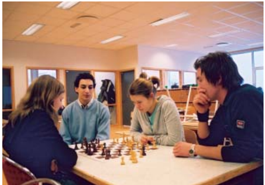
Elevene ser ut til å trives i det åpne landskapet.