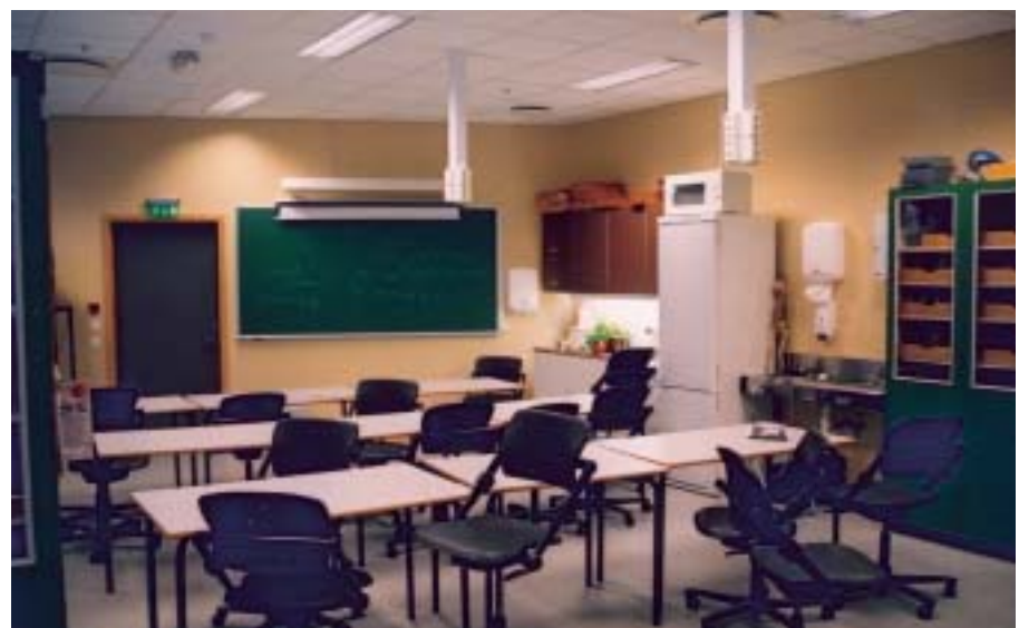
Trangt om plassen. Ikke plass til en hel klasse!