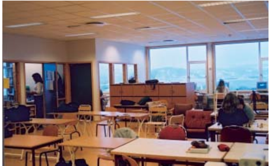
Kaotisk undervisningsrom for VKII. Bak glassveggen sitter lærerne.

det at fagseksjonsarbeid hemmes eller faller bort, og fravær av personalrom hindrer naturlig kontakt mellom alle allmenfaglærerne. Hvordan føre en levende skoledebatt her?