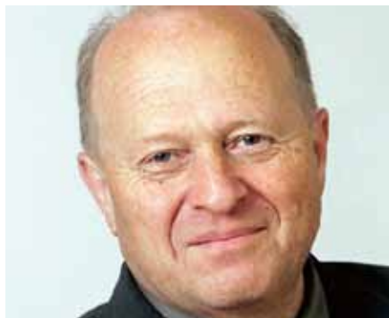
Odd Einar Dørum

Nært knyttet til dette er refleksjonen som arbeidsform. Denne må videreutvikles gjennom hele skoleverket. Det å ha en ballast i møtet med livet i en globalisert og teknologisk verden er avgjørende for både elever og lærere. Det å kontinuerlig