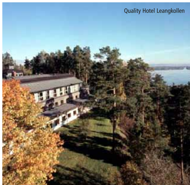
Quality Hotel Leangkollen

Formell innkalling og program vil bli sendt ut i uke 35. Sett av datoen allerede nå!