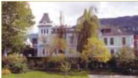
► Kultur for utdanning?