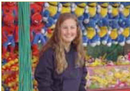
► Dobbeltarbeidande skoleelevar