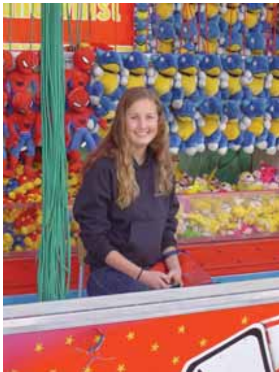
Mange elevar jobbar om kvelden og i helgene.

høgt materielt forbruk her og nå, framom utsiktene til ei solid og god utdanning, kan på sikt bli alvorlege. I fyrste omgang kan dei bli alvorlege for mange av ungdommane våre, som blir utsette for stor slitasje alt i unge år. Dersom dei held fram i same tempo ein del år framover, risikerer dei kanskje å bli utbrende og få alvorlege slitasjesjukdommar alt i ung alder. I neste omgang er det alvorleg for samfunnet at vi i så stor grad satsar på kortsiktig materielt forbruk i staden for å gi komande generasjonar den kunnskap og innsikt som skal til for at Noreg skal kunne hevde seg mellom dei andre nasjonane i verda.